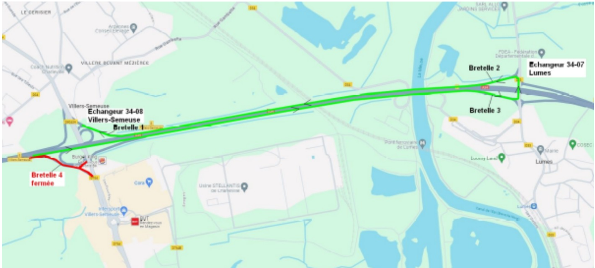
Schéma de déviation