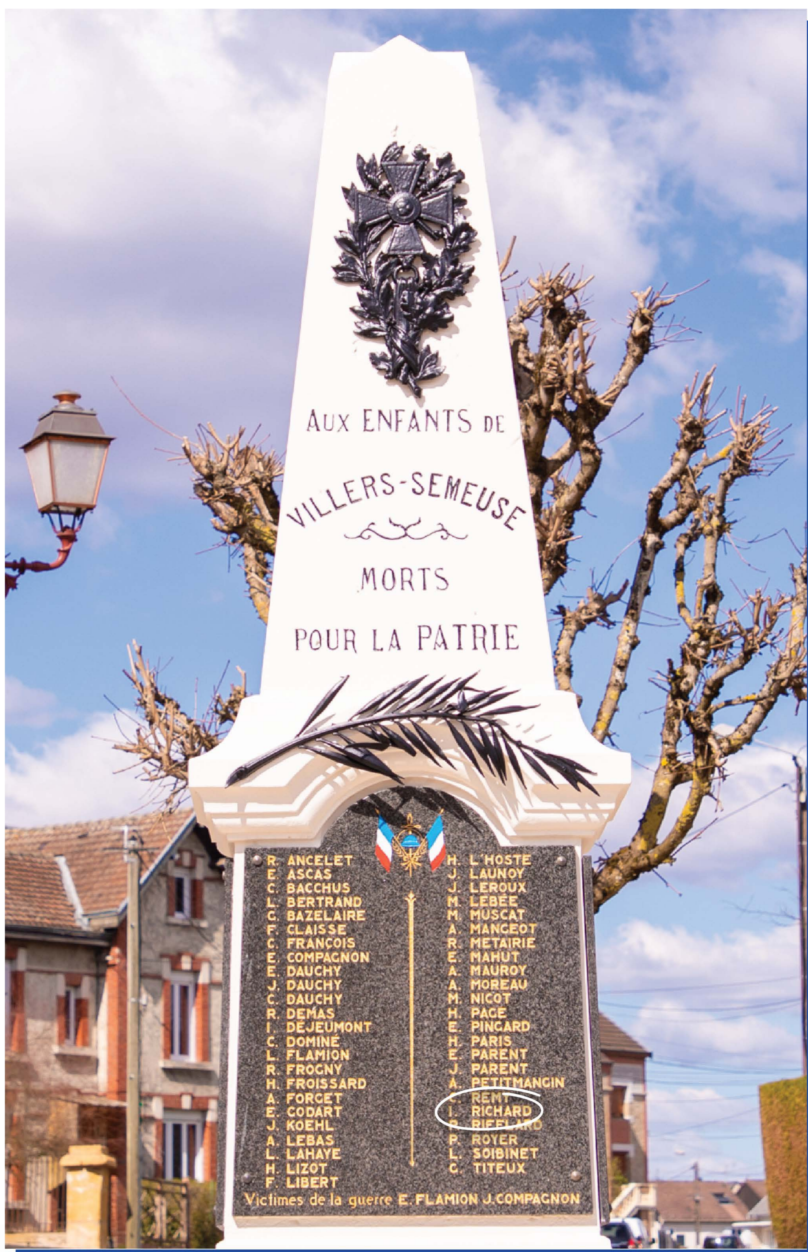
Figure dans le livre d'or de Villers-Semeuse.

Figure sur le monument aux morts de Villers-Semeuse.