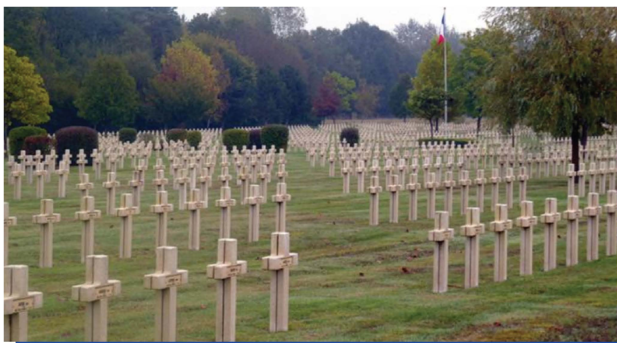
Nécropole nationale de Minaucourt

Mort pour la France à 22 ans. Mortellement frappé le 4 mars 1915 devant Mesnil-les-Hurlus (nommée actuellement Minaucourt-Le Mesnil-Les-Hurlus). Décès transcrit en 1920 dans le registre d'état-civil de Villers-Semeuse.