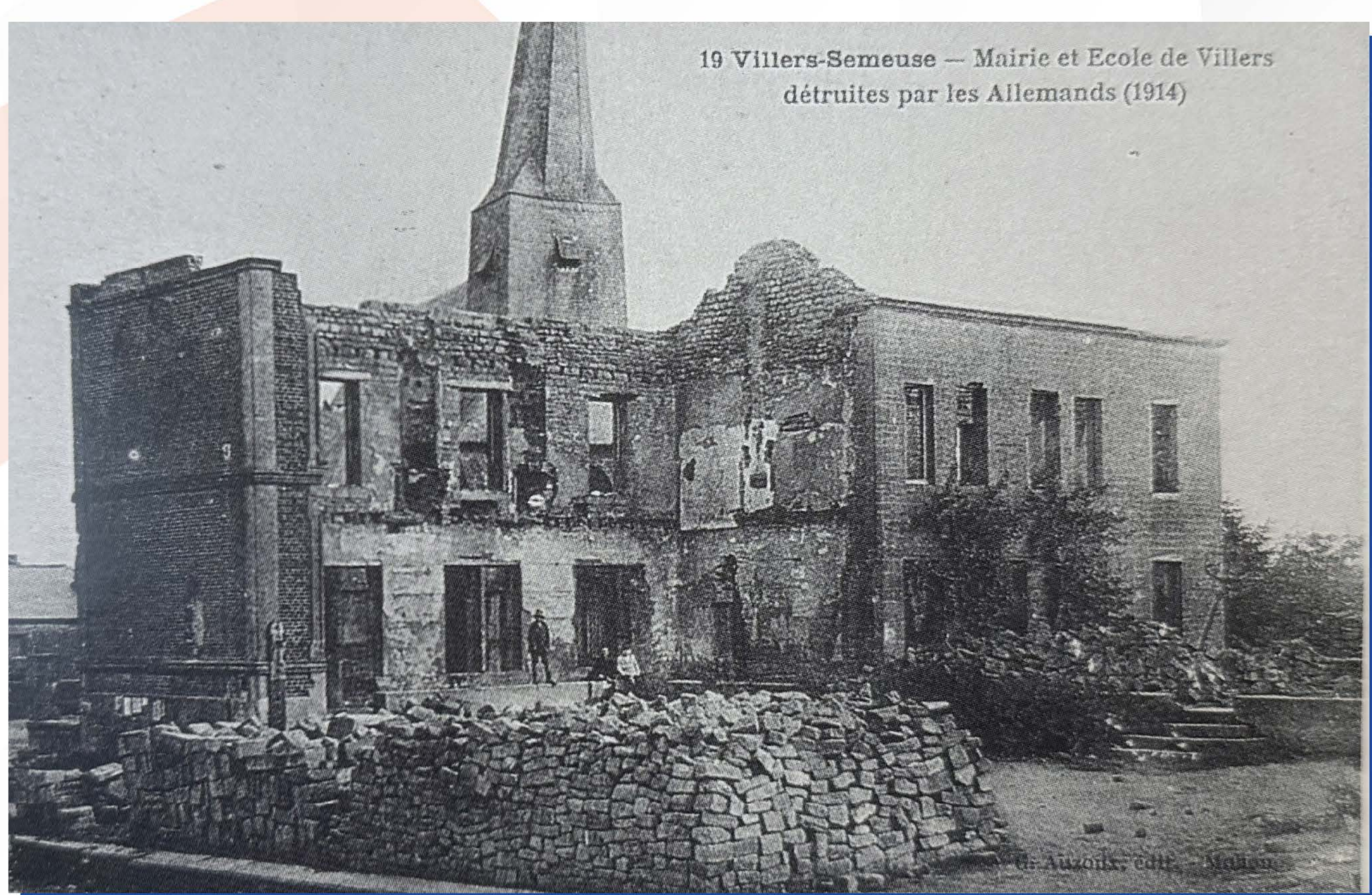
Bombardements de 1914 des allemands visant le Fort des Ayvelles atteignant Villers-Semeuse

Est né à Villers-Semeuse et y a résidé jusqu'à son service militaire en 1913. Ses parents ont vécu à Villers-Semeuse.