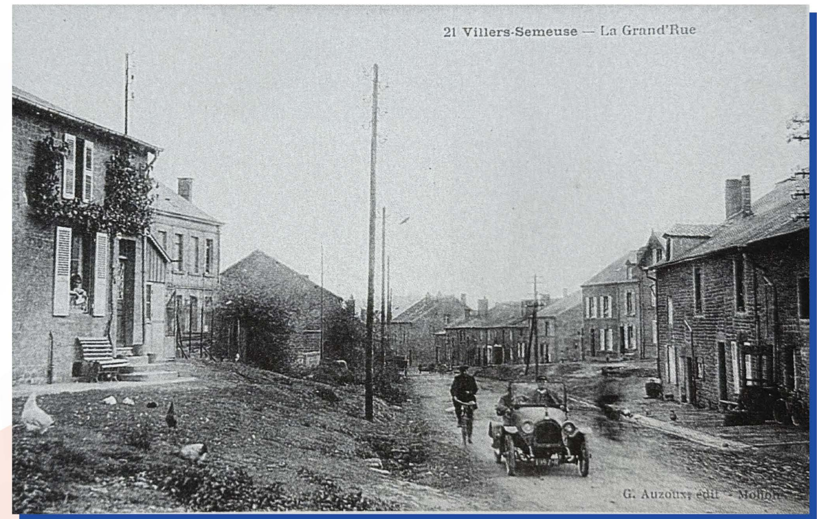
La Grand rue de Semeuse dans les années 1900-1914

Est né à Villers-Semeuse et y a résidé jusqu'à sa mobilisation en 1914. Ses parents ont vécu à Villers-Semeuse.