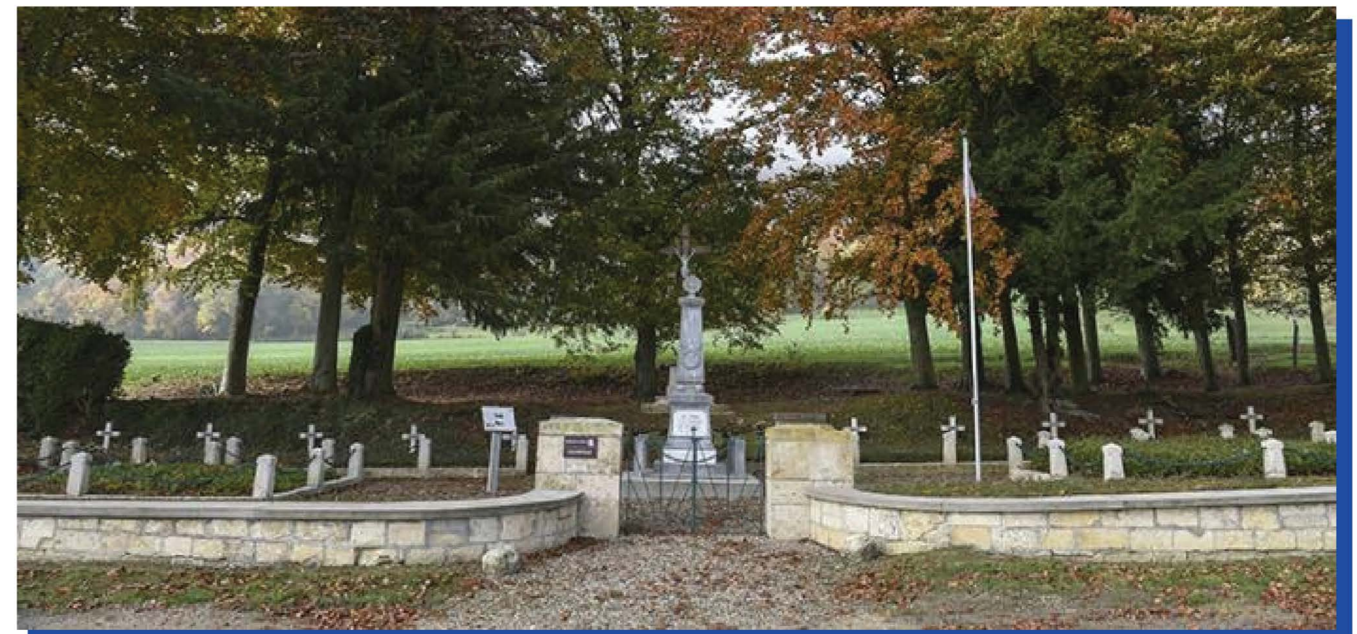
Nécropole nationale de Brandeville

Inhumé dans le département de la Meuse dans la nécropole nationale de Brandeville. Son nom est inscrit sur la plaque commémorative.