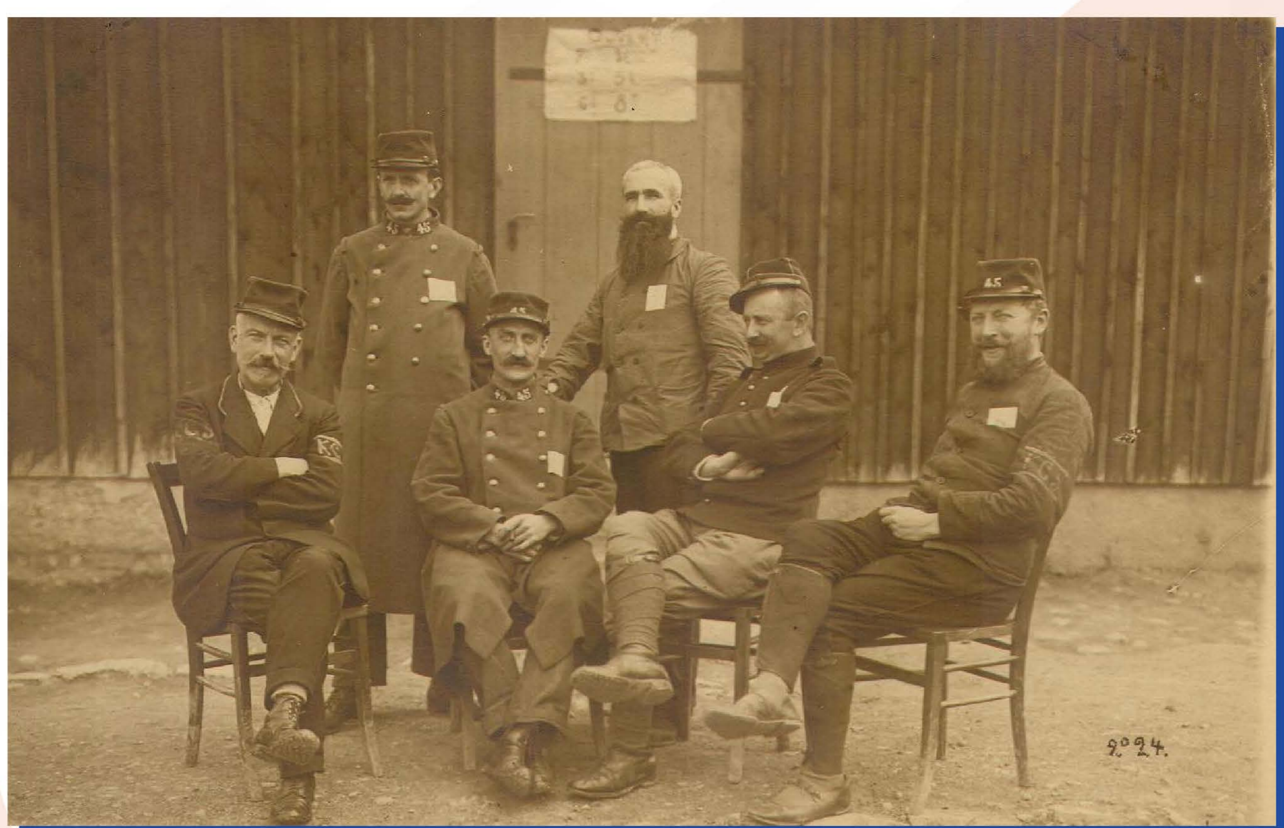
Soldats du 45 e régiment territorial dans un camp de prisonniers en Allemagne

Mobilisé par le 45 e Régiment d'Infanterie Territoriale en août 1914 puis comme soldat à la 9 e et 10 e Compagnie du 3 e Bataillon.