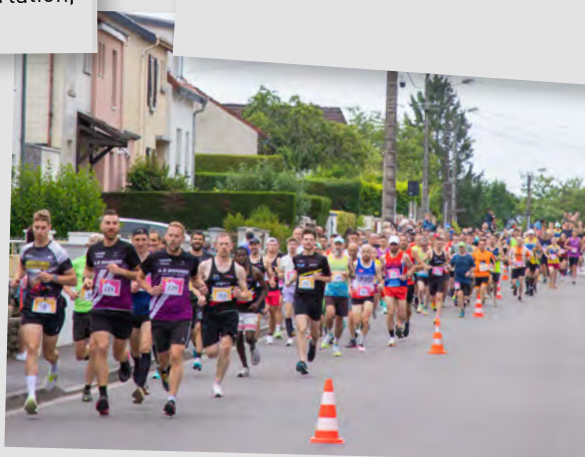
Les foulées villerssoises, 29 mai 2025.