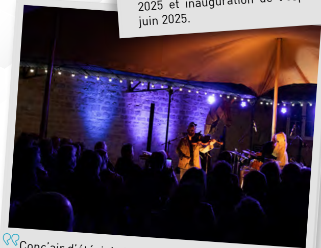
👉 Conc'air d'été, juin juillet et août 2025.