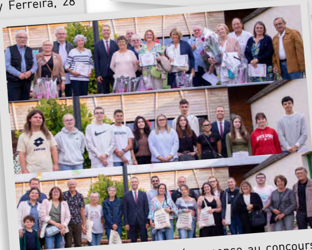
👉 Cérémonie de remise de récompense au concours des maisons fleuries, aux bacheliers 2025 et bienvenue aux nouveaux Villersois, 30 août 2025.