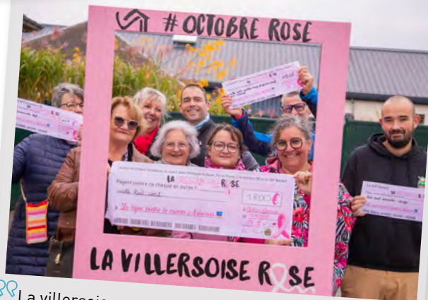
👉 La villersoise rose, 19 octobre 2025.