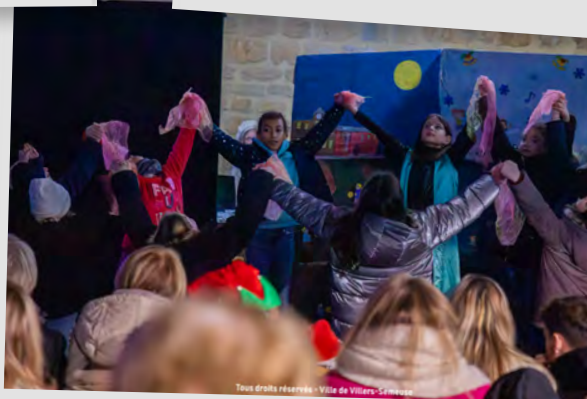
👉 Spectacle « les quatres lumières » à la lutinerie de Noël, 13 décembre 2025.