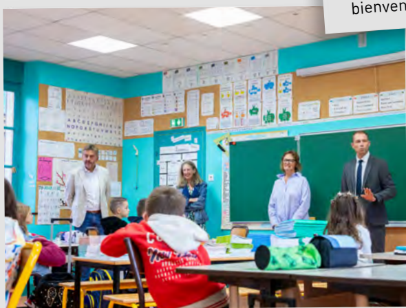
👉 Visite de rentrée scolaire, 1 er septembre 2025.