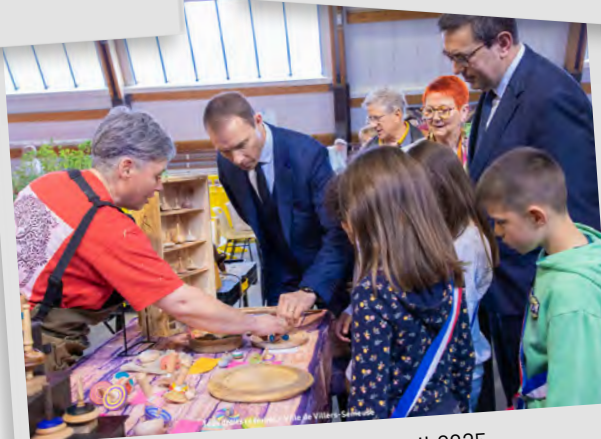
Marché de printemps, 26 et 27 avril 2025.