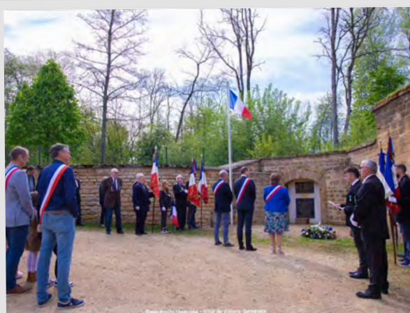
Cérémonie commémorative de la journée nationale du souvenir des victimes et héros de la déportation, 27 avril 2025.