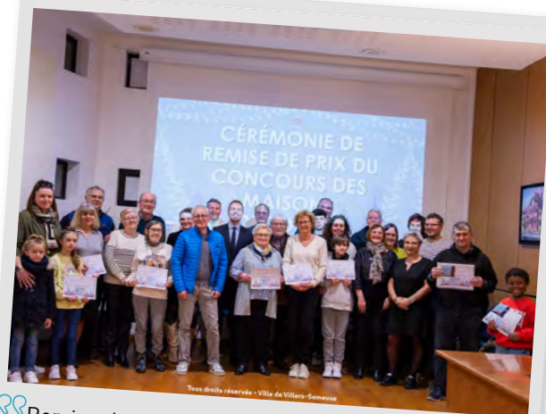
Remise de prix des maisons décorées hiver 2024, 4 février 2025.