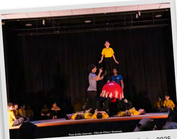
Villers fait son cirque, 31 janvier et 28 février 2025.