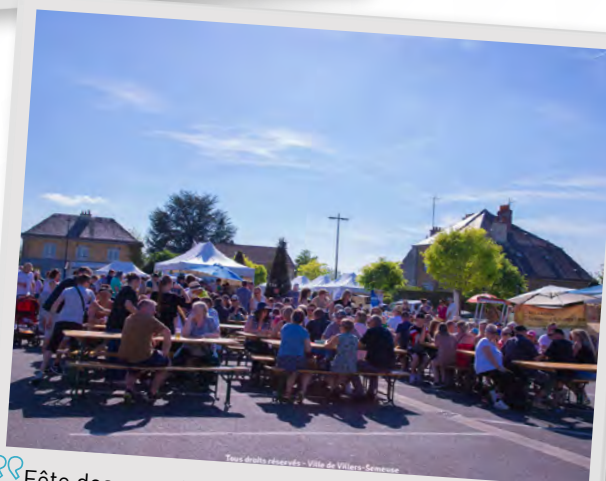
Fête des associations, 1 er mai 2025.