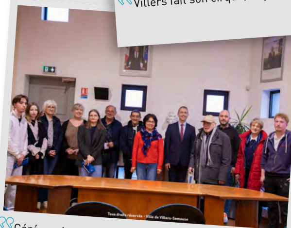
Cérémonie de citoyenneté, 28 mars 2025.