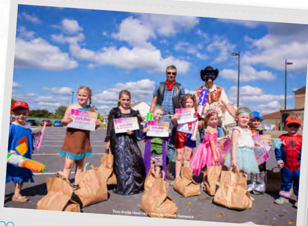
👉 Villers parade et concours de déguisement enfants, 28 juin 2025.