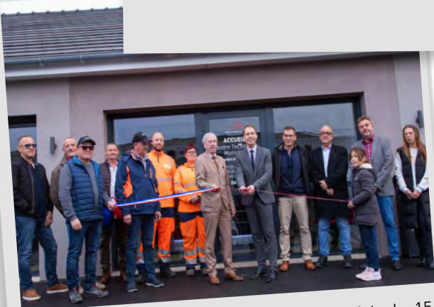
👉 Inauguration du centre technique municipal, 15 novembre 2025.