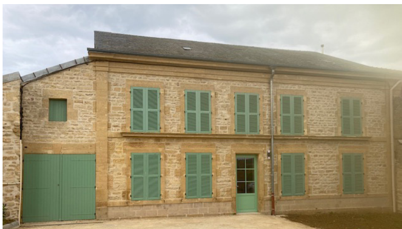
Rénovation de la façade de l'ancien presbytère de CHEVEUGES avec la création de deux logements locatifs.