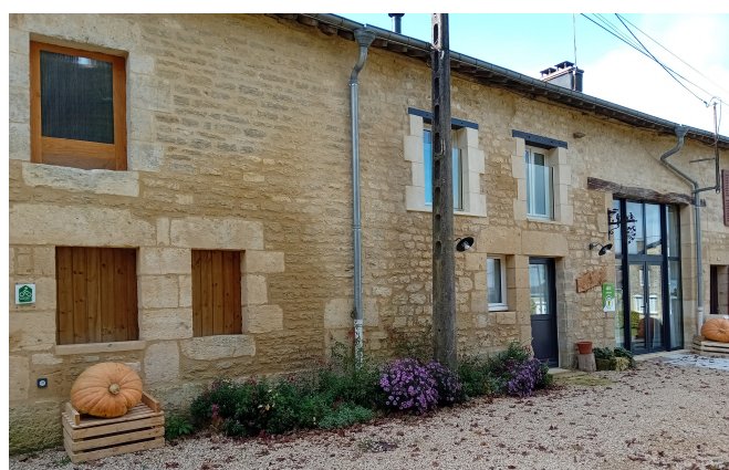
Rénovation d'une façade ancienne à BULSON .