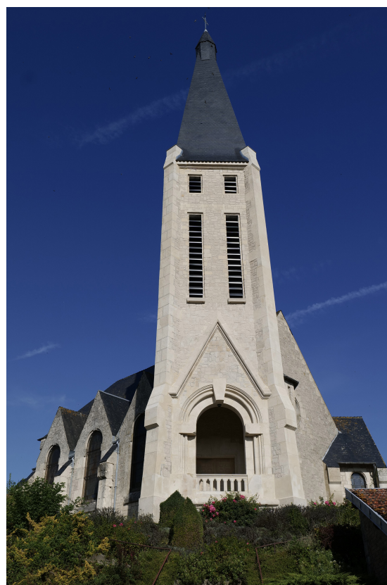
Rénovation de la façade de l'église de MANRE .