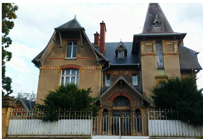
Travaux sur une maison à SEDAN avec le label de la Fondation du Patrimoine

Contact : Fondation du Patrimoine Délégation Champagne Ardenne Bernard de Lauriston fixe 03 26 97 81 72 - Mobile 07 88 49 65 70 bernard.delauriston@fondation-patrimoine.org