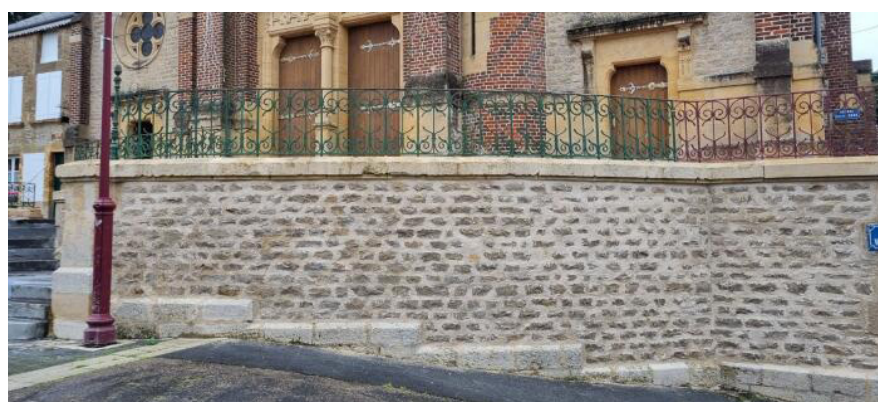
Rénovation d'un muret au centre de BALAN .

Ensemble, continuons à embellir nos communes et à accroître l'attractivité des Ardennes !