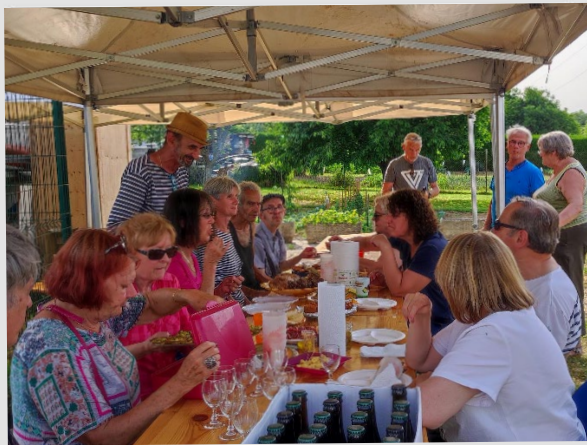
💡 Dégustation de la bière du Sel'Arden par l'association, 19 juin 2022.