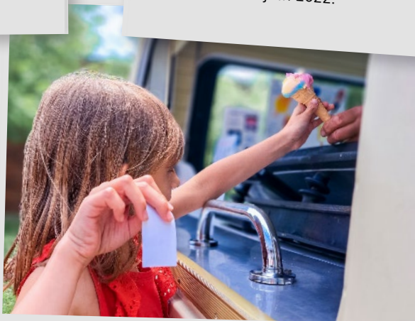
💡 Opération glace du glacier ROLAND initiée par le Collège Jules Leroux, 20 juin 2022.