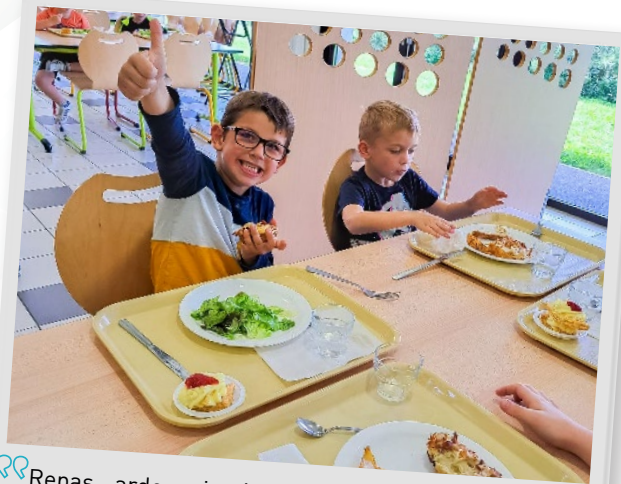
💡 Repas ardennais à la restauration scolaire à l'occasion de l'opération « Les #Ardennes dans votre assiette », 2 juin 2022.