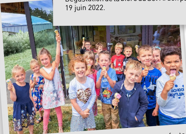
💡 Glace du glacier ROLAND pour les enfants fréquentant la restauration scolaire de l'A.L.S.H., 20 juin 2022.