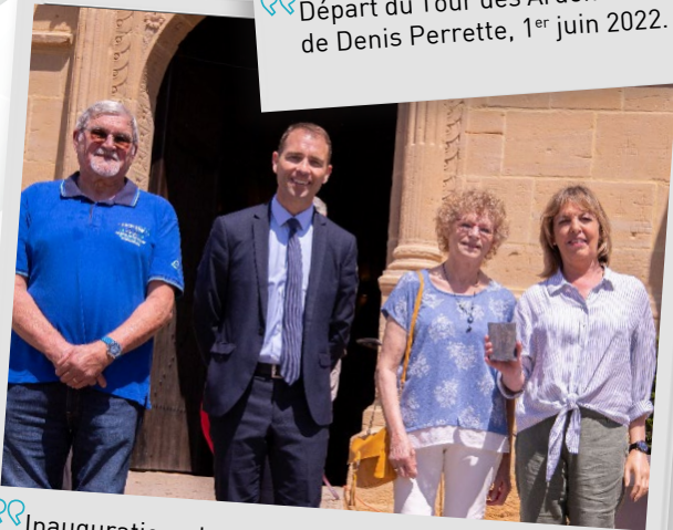
💡 Inauguration des 400 ans de la consécration de l'église et des travaux de restauration de l'église, 4 juin 2022.