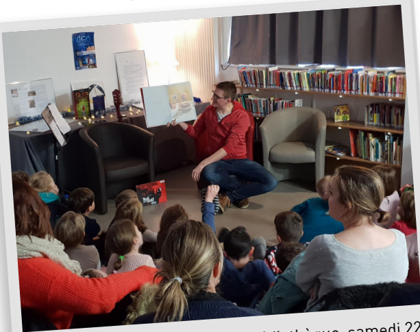
Heure du conte de Noël à la médiathèque, samedi 22 décembre 2018.