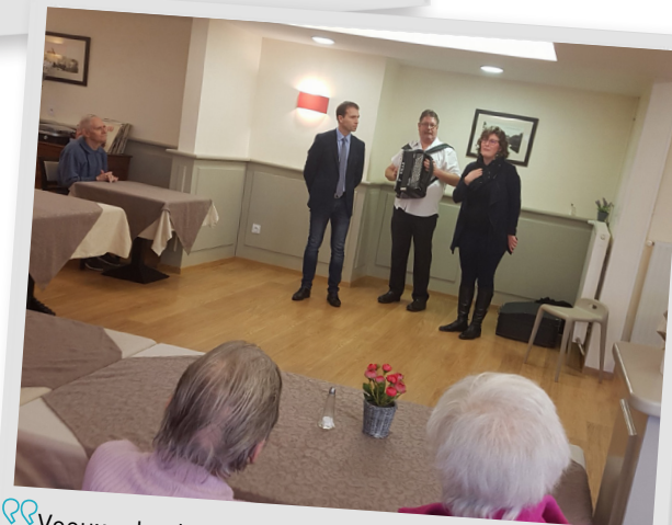
Vœux de la municipalité aux résidents de la Résidence Ducale, jeudi 10 janvier 2019.