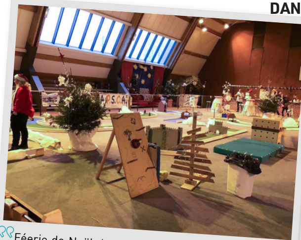
Féerie de Noël de l'APSCA, dimanche 30 décembre 2018.