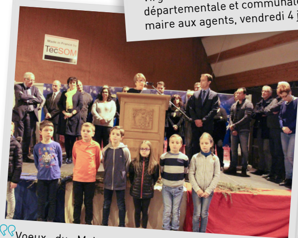
Vœux du Maire et du conseil municipal à la population, samedi 5 janvier 2019.