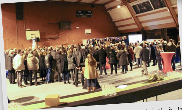
Vœux du Maire et du conseil municipal à la population, samedi 5 janvier 2019.