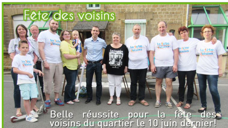
Belle réussite pour la fête des voisins du quartier le 10 juin dernier!